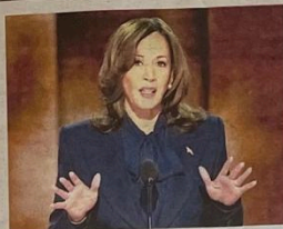
Kamala Harris alla convention di Chicago

perare il cinismo, il rancore e le divisive battaglie del passato. Abbiamo la chance di tracciare una nuova strada da seguire», ha detto, concludendo lo slogan «A new way forward» e pronunciando un discorso che ha cavalcato l'ondata del patriottismo. GUERRERA / PAGINA 2