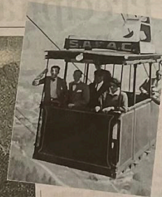
Edda Ciano Mussolini presenza alla cerimonia d'inaugurazione della funivia del Faloria che porta al rifugio intitolato per l'occasione proprio alla figlia del Duce.

Poi vennero le Olimpiadi che avrebbero dovuto disputarsi nel '44, a causa della seconda guerra spostate nel '56. Cortina, grazie alle immagini della Rai, viene conosciuta nel mondo e si realizzano nuovi impianti, come il Lagazuoli nel '64, che compie sessant'anni, e la Freccia del Cielo che porta fino ai 3244 della Tofana di Mezzo. La nascita nel 1974 del Dolomiti Superski porta a un ulteriore sviluppo: lo sciatore non è più vincolato a restare in unico comprensorio, ma può spostarsi da una valle all'altra, facendo dimenticare gli anni in cui si saliva e si scendeva sempre da un'unica pista. E il dopo Olimpiadi 2026 cosa riserverà? La risposta dal documentario di Giulia Apollonio che dopo Cortina sarà proiettato anche alla Mostra del Cinema di Venezia: «Gli studi del Cnr evidenziano come sotto una certa quota le temperature scendono sotto lo zero 37 giorni in meno rispetto a cinquant'anni fa. Bisogna pensare a modi di fruizione della montagna diversi. Quindi impianti che si sostituiscono all'uso delle auto, che vengono eliminati quando non servono, che funzionano utilizzando energia rinnovabile, che rendono accessibile a tutti la montagna. Non possiamo pensare di andare avanti secondo vecchie formule. Solo chi capirà questa trasformazione riuscirà a stare al passo con i tempi e a sopravvivere».