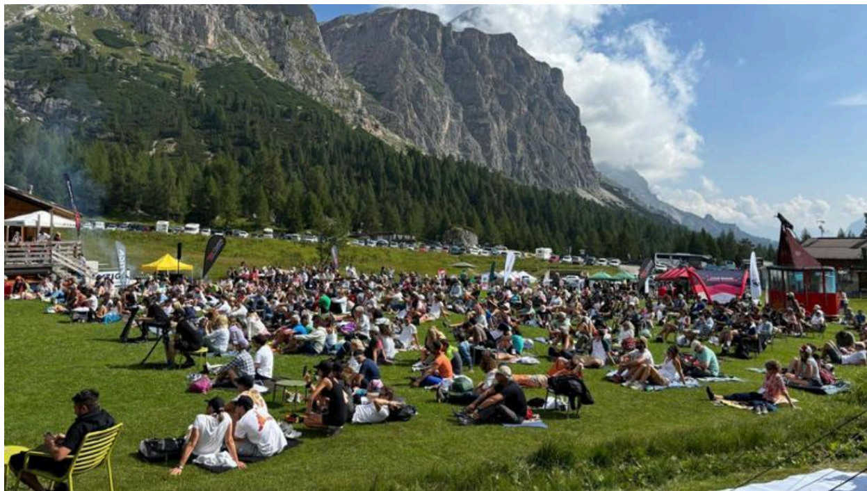
Il pubblico presente in Col Gallina per il TedxCortina

23 Agosto 2024 alle 15:271 minuto di lettura